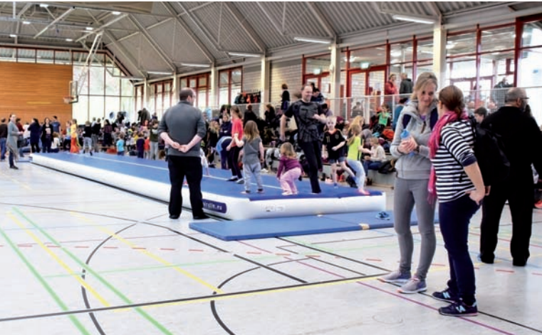
Eine Attraktion: die Air-Track-Bahn

Für die TG ist der Bewegungsdschungel jedes Jahr ein Großprojekt. Zahlreiche Helfer aus allen Abteilungen des Vereins sind dafür nötig. Nach der wochenlangen Vorarbeit war es für alle Beteiligten ein schönes Erfolgserlebnis, dass sie diesmal noch mehr Resonanz gefunden haben als in den letzten Jahren und organisatorisch alles geklappt hat.